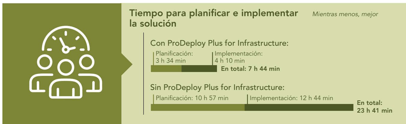
Figura 2: Tiempo para planificar e implementar nuestra solución con y sin Dell ProDeploy Plus for Infrastructure.

Nuestro personal interno solo participó en la aportación de información durante la fase de planificación de la implementación de ProDeploy Plus for Infrastructure. Proporcionaron información sobre el entorno (como la configuración de los conmutadores, la asignación de direcciones IP, etc.) y aprobaron las propuestas de redes, almacenamiento y servidores de los arquitectos de soluciones. Nuestro personal no tuvo que desempaquetar, montar en los bastidores ni implementar hardware, ya que el ingeniero certificado de Dell Technologies se encargó de cada una de estas tareas y otros expertos de Dell ayudaron con la planificación.